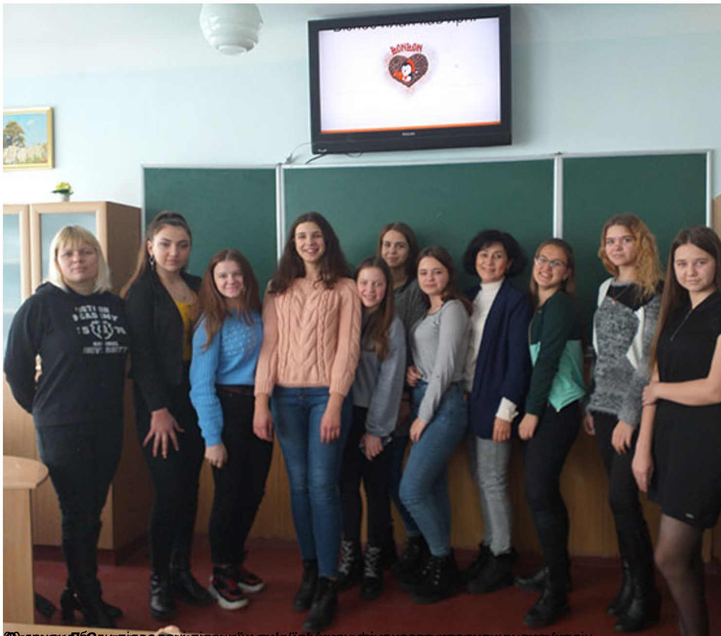
Самодіяльність головної комісії фінансово-кредитної дисципліни.