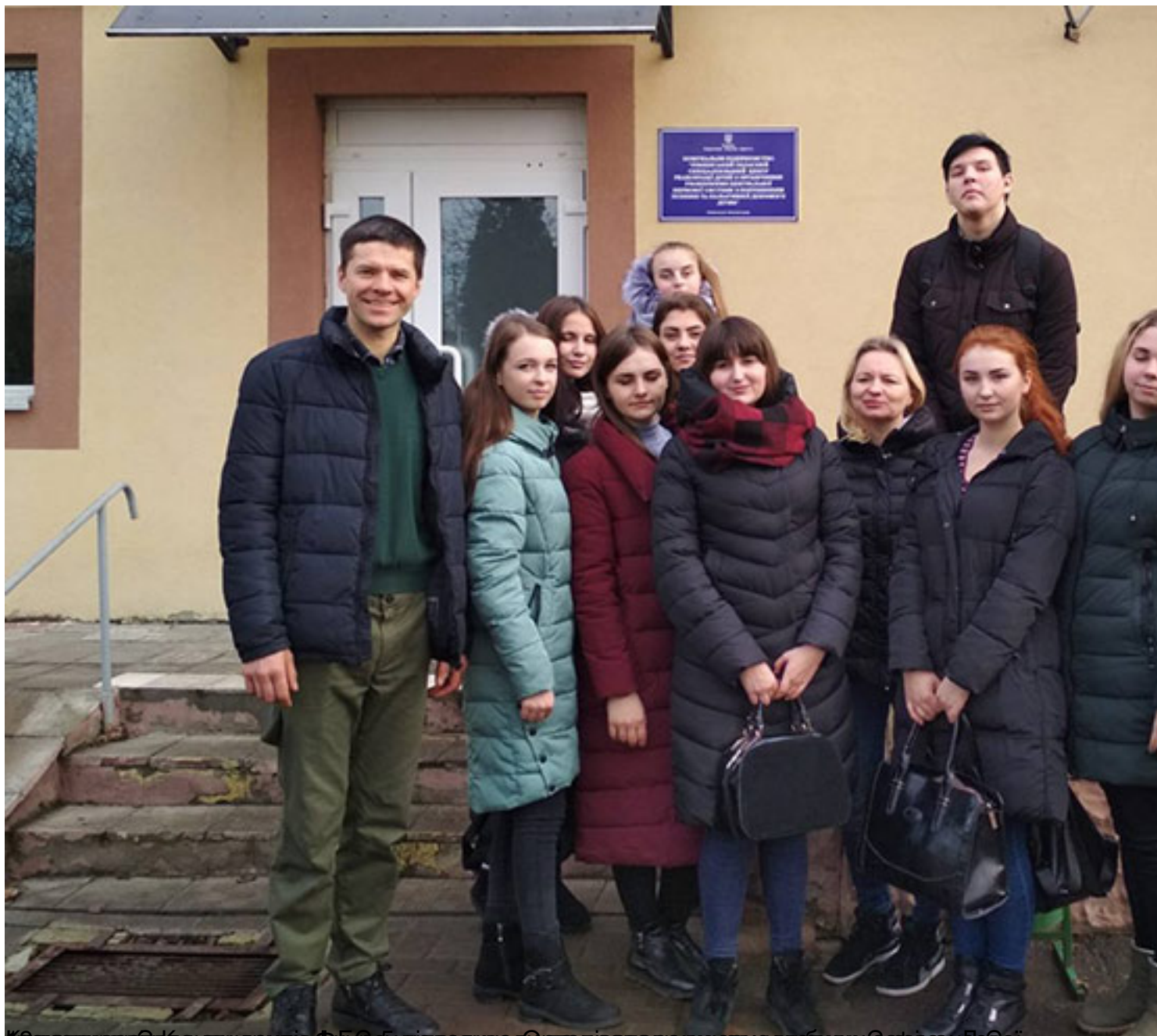
Кандидатки студентів ФБФУ підтедувал Організація вижвудубулу Саріан Бовсі